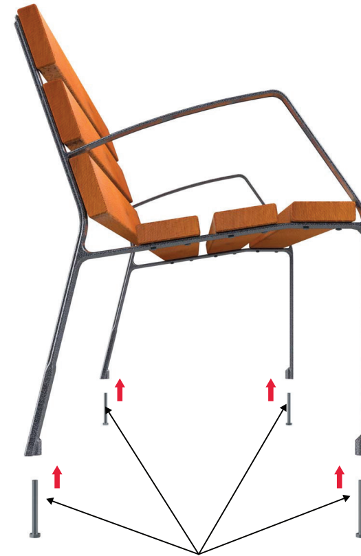
Tornillos DIN 933 10 x 110 mm

Acoplar los 4 tornillos DIN 933 M10 x 100 mm a cada agujero de la pata (incluidos en el escaño).